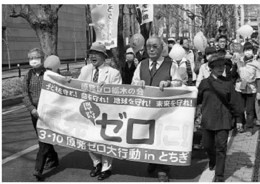
パレードで市民にアピールする参加者＝宇都宮市

東電福島第1原発事故から2年を迎えた10日、「3・10原発ゼロ大行動インとちぎ」（原発ゼロ栃木の会主催）が宇都宮市で開催されました。