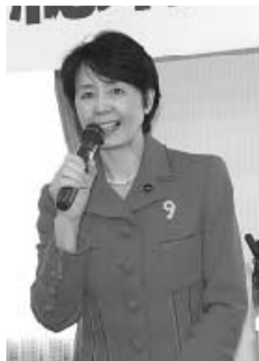
必勝へ決意表明する紙参院議員 ＝宇都宮市