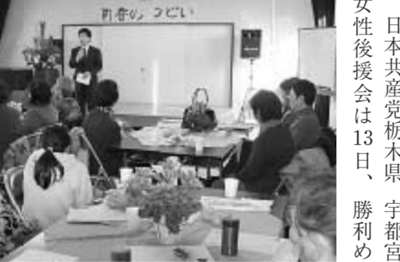
活発な意見で盛りあがった集い＝宇都宮市

日本共産党栃木県 宇都宮市内で参院選 女性後援会は13日、 勝利をめざす新春の集 いを開き、 35人が参 加し、参 院選 を、 「衣 伝を行いたい」と述 べました。 市内の女性は「衆 議院選挙の結果は残念 だったが、次は前に すすませるとい う決 意ですぞみま す」と話し、小山市からの 参加者は「衆議院選 では、ピラ配布などを したが、次の選挙で は、ハンドマイク宣 伝を行いたい」と述 べました。