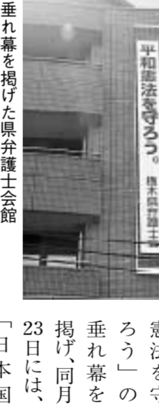
垂れ幕を掲げた県弁護士会