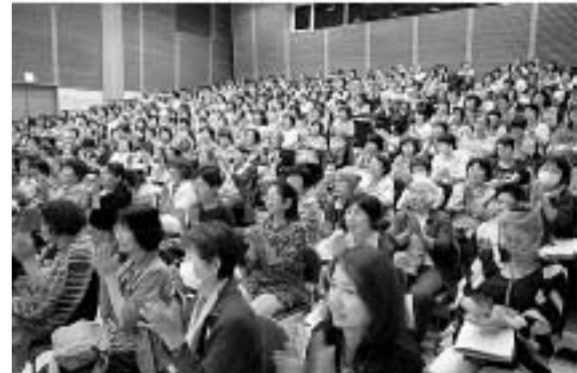
講演に聞き入る参加者

第50回栃木県母親大会は14日、宇都宮市で開かれ、全体会は市立南図書館(午後)、分科会は県立宇都宮工業高校など(午前)で行なわれ、のべ700人を 分科会では、「自衛隊基地のある町から見えるもの」として、陸自北宇都宮駐屯地と宇都宮駐屯地をまわりま また、世界に誇る日本国憲法を守る立場を力強く掲げた特別決議を採択。「生命をうみだす母親は生命を育て生命を守ることをぞめます」とのスローガンのもと、戦争法案を廃案させるまで運動する」と呼びかけました。次回開催地は、壬生町です。